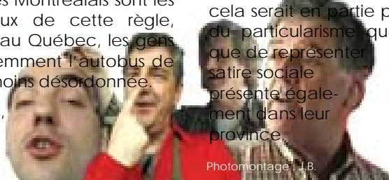
Photomontage : J.B.

Québec reste le plus innovant notamment en matière de critique sociale. Nous aimons bien rire et s'il le faut rire de nous même. A titre d'exemples pour illustrer ces propos, sont les émissions de télévision telles La petite vie il y a quelques années et plus récemment une télé série intitulée Les Bougons. Cette dernière se voulait une satire sociale des réalités québécoises dont le chômage. Une telle émission ne verrait pas le jour aux Etats-Unis car toutes les émissions représentent la vie de la classe moyenne où il n'y a aucune difficulté sociale. Au Canada anglophone, il y a fort à parier que si ce type d'émission était acheté et présenté au grand public, cela serait en partie pour se moquer du particularisme québécois plutôt que de représenter la satire sociale présente également dans leur province.