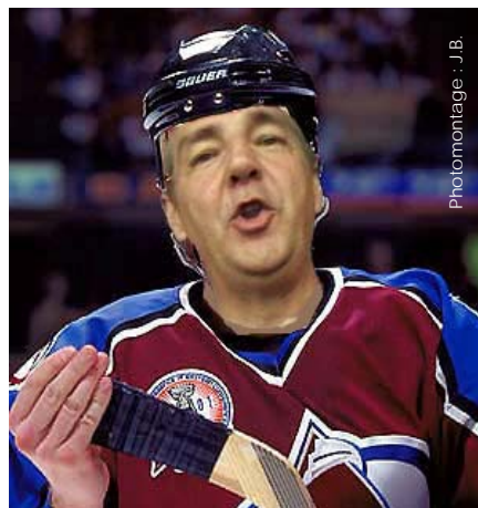
Photomontage : J.B.

En tant que française, le hockey c'était pour moi le sport favori de « Mac Gyver », série américaine dont le héros est capable de se sortir des pires situations avec seulement du scotch, un couteau suisse et sa connaissance parfaite de tous les éléments chimiques de l'univers. Mis à part ça, je savais juste que les joueurs étaient sur des patins à glace et qu'ils ressemblaient à des bonhommes Michelin...ben oui, icitte c'est plutôt foot non?